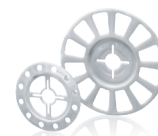
široký prostorový talířek SBL 140 plus a VT 90