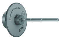
ejotherr ® STR-tool 2GE