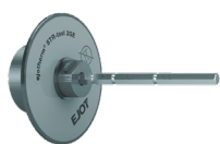
ejothem® STR-tool 2GE